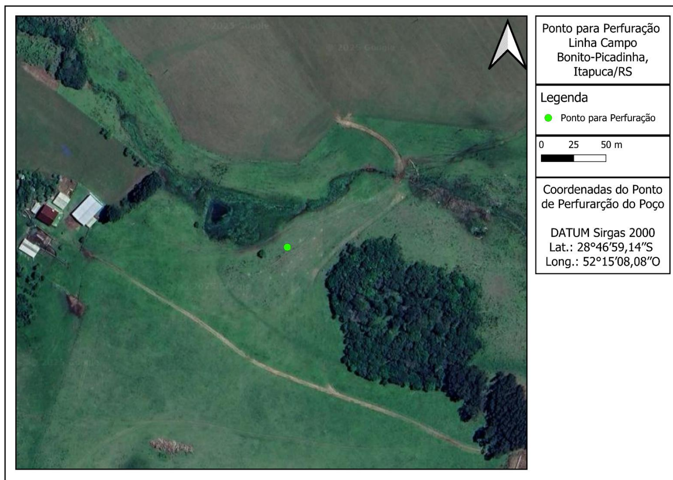
Figura 2 - Mapa de situação ponto para perfuração.